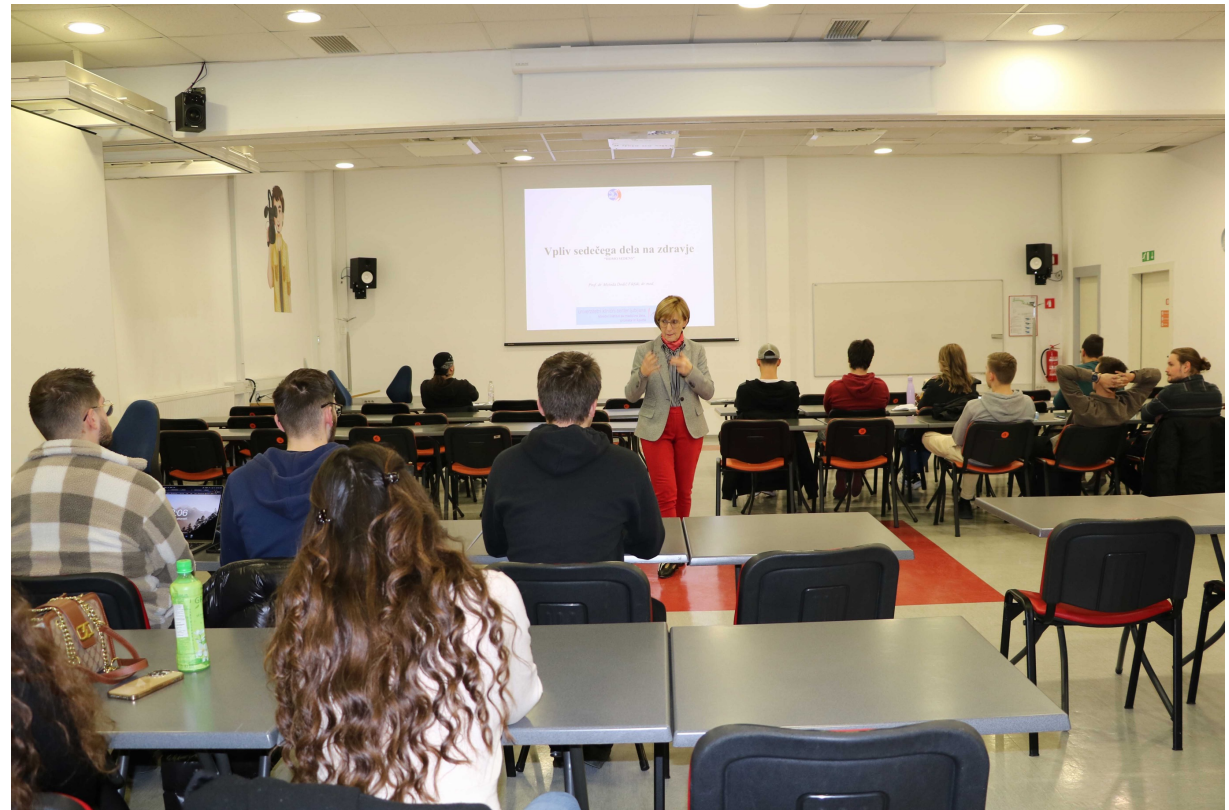
Metoda Dodič Fikfak Vpliv sedečega dela na zdravje