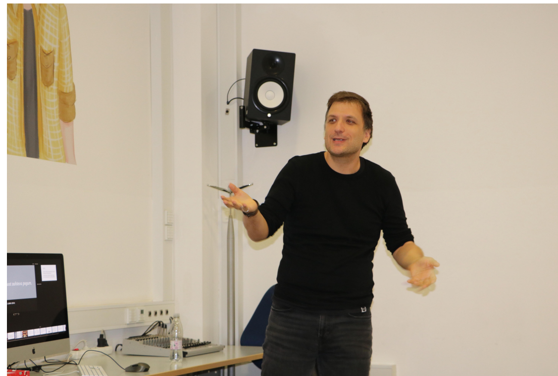
Vladimir Petković Programsko vodenje izven centrov moči